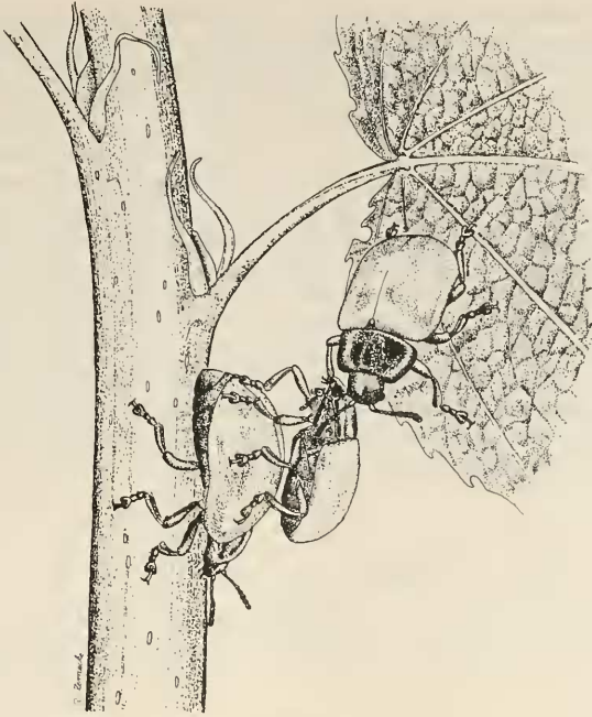
Abb. 1: Eine Kampfsituation beim Espenblattkäfer M. tremulae (L.): Der Besitzer läßt den auf dem Blatt sitzenden Rivalen nicht los, während das Weibchen stammabwärts drängt.

Der Kontakt zum Weibchen geht manchmal verloren (in 30 % der beob. Fälle), nicht immer weil die Zugkräfte zu stark werden, sondern weil das Männchen die anhaftenden Tarsen löst und absteigt. Die Männchen bleiben danach weiterhin verbissen (bis zu 20 Min.). Das abrückende Weibchen sucht häufig gleich das Weite, andere kommen zurück, laufen über die Männchen und gehen dann fort. Andere Weibchenverluste entstehen nach einem Sturz des Weibchens oder bei Störung durch ein drittes Männchen.